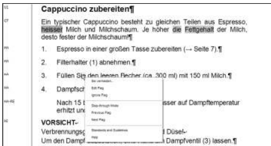
Abb. 2: Rückmeldung des Prüfwerkzeugs acrocheck auf einen Fehler in einem nach Funktionsdesign entwickelten Text

Stilregeln beziehen sich – wo vorhanden – auf die Funktionsdesign-Elemente im Text. So gelten z. B. unterschiedliche Werte für die maximale Satzlänge für den Grundtext, Handlungsanweisungen und Überschriften.